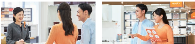
コーディネーターと一緒に見学